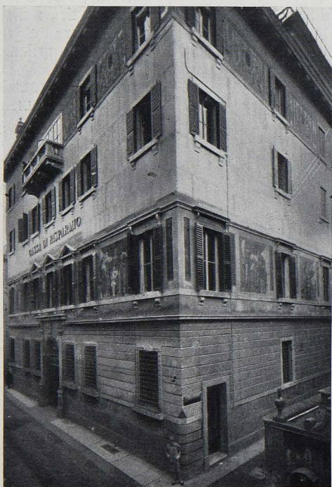
VERONA : PALAZZO DELLA CASSA DI RISPARMIO.

Non rimpiangiamo ad ogni modo quello che