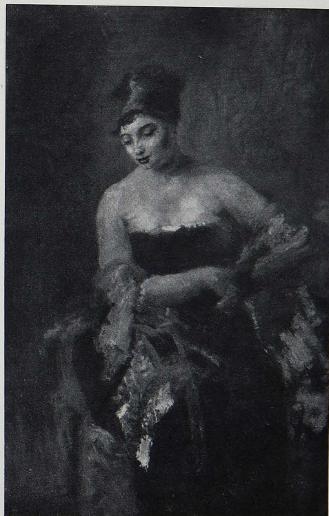
E. GOLA: IL NASTRO AZZURRO (GALL. MILANO).