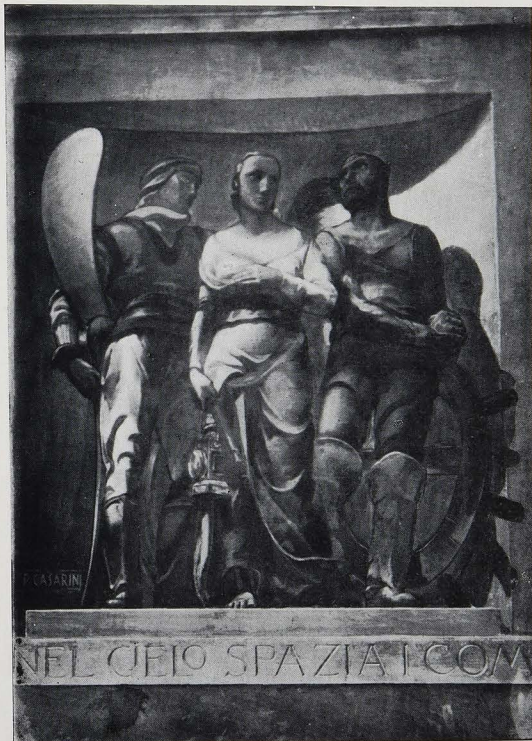
PIO CASARINI: SULLA TERRA, SUL MARE, E NEL CIELO.