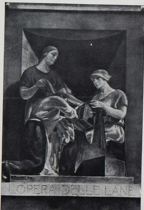
ANGELO ZAMBONI: L'OPERA DELLE LANE. VERONA, CASSA DI RISPARMIO.

svalutano tante altre composizioni del genere: ben rispondente, insomma, a quei criteri di forma e di stile dei nostri tempi, che sono essenziali in opere di tale natura; ma che non possono essere risultato solo di distillazioni teoriche od espressione di mode passeggere; bensì frutto spontaneo d'un chiaro concetto d'arte. Quello, in una parola, pel quale Pio Casarini ed Angelo Zamboni meritano sotto ogni riguardo d'esser presi nella più attenta considerazione da quanti non disperano nelle risorse d'energie che sono sempre in fondo alla buona razza dei nostri artisti.