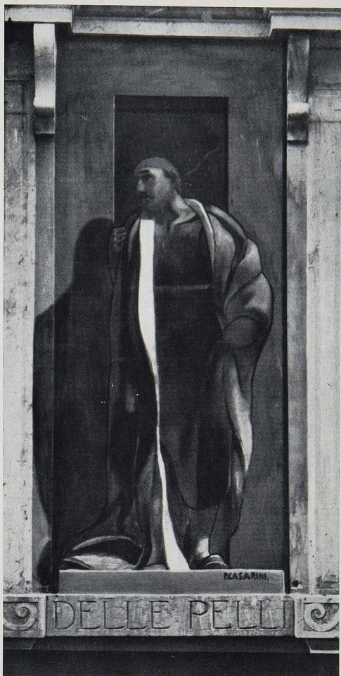
PIO CASARINI: L'OPERA DELLE PELLI. VERONA, CASSA DI RISPARMIO.

L'originalità splendente della sua visione lirica, i chiarori esaltanti de' suoi paesaggi, le sue luci drammatiche, le sue prospettive ansiose, gli accenti plastici vigorosi e pulsanti, gli schemi architettonici delle sue serrate composizioni, se-